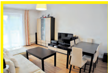
Otwock – mieszkanie 54 m 2 , 2 pok., piętro: 2/3, Wioska Szwajcarska, balkon. Cena: 305 000 PLN, oferta: 2274/OMS www.portman.com.pl, tel.: 517 445 776