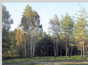
Glinianka, pow. 1250 m 2 , WZ na wolno stojący dom jednorodzinny, media: prąd oraz woda miejska, dojazd drogą asfaltową, w okolicy las, stadnina koni, domy jednorodzinne, cena: 79 000 zł, tel.: 790 740 210, WWW.CITIHOME.EU