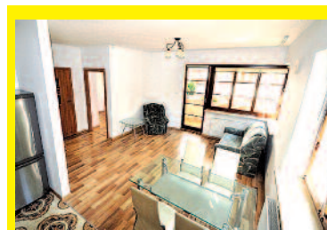
Otwock – mieszkanie, 44 m 2 , 2 pokoje, PARTER, centrum, os. zamknięte, garaż. Cena: 299 000 PLN, oferta: 2453/OMS www.portman.com.pl

■ Karczew, ul. Maczka, 48 m 2 , 3 piętro, 2 pokoje, balkon, piwnica, widna kuchnia, do odświeżenia, cena: 179 000 zł, tel.: 513 401-901