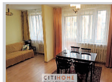
Otwock, ul. Andriollego, 29 m 2 , trzecie piętro, po remoncie, do wprowadzenia, niski czynsz, cena: 165 000 zł, tel.: 513 401 901

■ Otwock, ul. Pułaskiego, 39 m 2 , 4 piętro, 2 pokoje, widna kuchnia, balkon, piwnica, do remontu, cena: 169 000 zł, tel.: 507 847 874