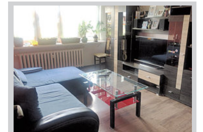
Otwock, Karczewska, 38 m 2 , 4 piętro, 2 pokoje, widna kuchnia, piwnica, w pełni umeblowane, do wprowadzenia, po generalnym remoncie, cena 215 000 zł, tel. 507 847 874, Cithome Nieruchomości