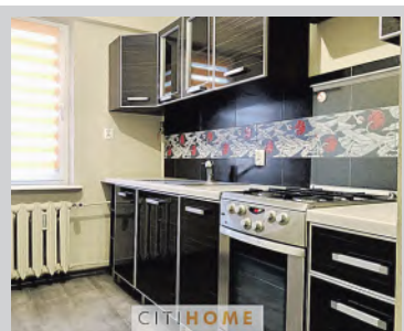
Osiedle Ługi, 36 m 2 , 3 piętro, 2 pokoje, widna kuchnia, balkon, piwnica, cena 225 000 zł, tel. 507 847 874, Citihome Nieruchomości